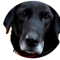
愛犬ミコ 2005年ダメ犬選手権出場

うれしかったこと くやしかったこと みんな ここに つまっている わらいごえも なきごえも みんな ここで ひびいている ♪卒業ソング「ずっときくとふじみ」より